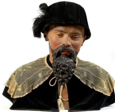
Buste van Van Schoonbeke (Maagdenhuis Antwerpen)

In 2019 is het 500 jaar geleden dat Gilbert van Schoonbeke in Antwerpen het levenslicht zag. Wie was deze Antwerpse bouwondernemer, projectontwikkelaar en financier? Wat heeft Rumst met Van Schoonbeke te maken en omgekeerd?