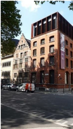
Huidig zicht op het Brouwershuis. Rechts ervan stond brouwerij 'Rumpst'

Rumst is enkele jaren belangrijk geweest voor het dagelijks bier van de Antwerpenaar. Misschien een idee om in Antwerpen een biertje 'Rumpst' te brouwen, als dank voor het Rumsts water.