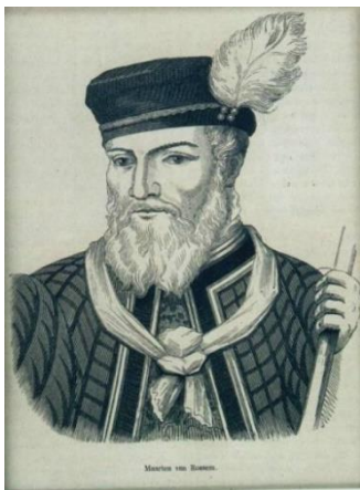
Maarten van Rossum

De eerste helft van de 16de eeuw was niet altijd even rustig voor onze streken. Maarten van Rossum trok in 1542 al plunderend door onze gewesten. Hij belegerde Antwerpen maar zijn